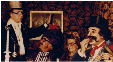
Familiensache filmschool.forum ZHdK I Di 10.05. (14:00, Filmmuseum)