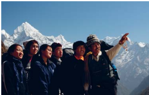
Good Bye Tibet Münchner Premieren Mi 11.05. (18:30, ARRI Kino)