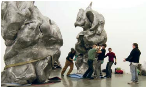
Urs Fischer DOK.panorama Sa 07.05. (15:30, Pinakothek der Moderne) W: So 08.05. (21:30, City 3)