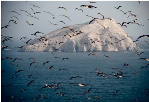
Guañape Sur Filmschool.forum ZeLIG II Mo 09.05. (16:45, Filmmuseum)