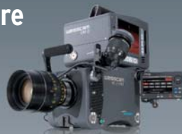
WEISSCAM HS-2 MKII