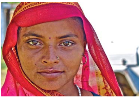
Pink Saris DOK.international Sa 07.05. (15:00, Atelier 1) W: Di 10.05. (20:00, Atelier 1)