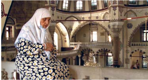
Hüllen filmschool.forum ZHdK I Di 10.05. (14:00, Filmmuseum)