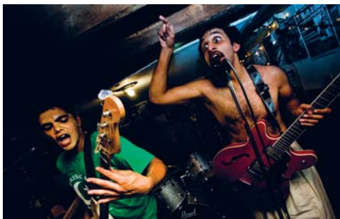
Taqwacore: The Birth of Punk Islam DOK.panorama Fr 06.05. (22:30, Atelier 1) W: Di 10.05. (22:00, Atelier 2)