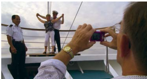
Für die Dauer einer Reise Münchner Premieren Mi 11.05. (21:00, ARRI Kino)

filmschool.forum 9:00 - 13:00 h (City 3) Eintritt frei