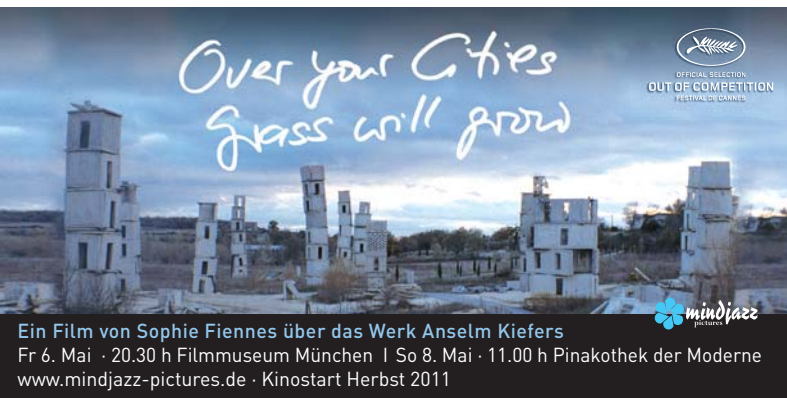
Ein Film von Sophie Fiennes über das Werk Anselm Kiefers Fr 6. Mai · 20.30 h Filmmuseum München | So 8. Mai · 11.00 h Pinakothek der Moderne www.mindjazz-pictures.de · Kinostart Herbst 2011

DOK.panorama Taqwacore: The Birth of Punk Islam „Mohammad was a Punk Rocker“ ist der Titel eines Songs und das Credo amerikanischer Muslim Punks. Anarchie und Allah – das versuchen die Taqwacores zu vereinen. Ein provokantes Tour-Tagebuch. Omar Majeed (CDN/PA/USA 2009, 80 Min., divOmeU)